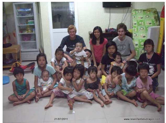
Orphelinat "Nhà Mẹ Côì Truyền Tin"